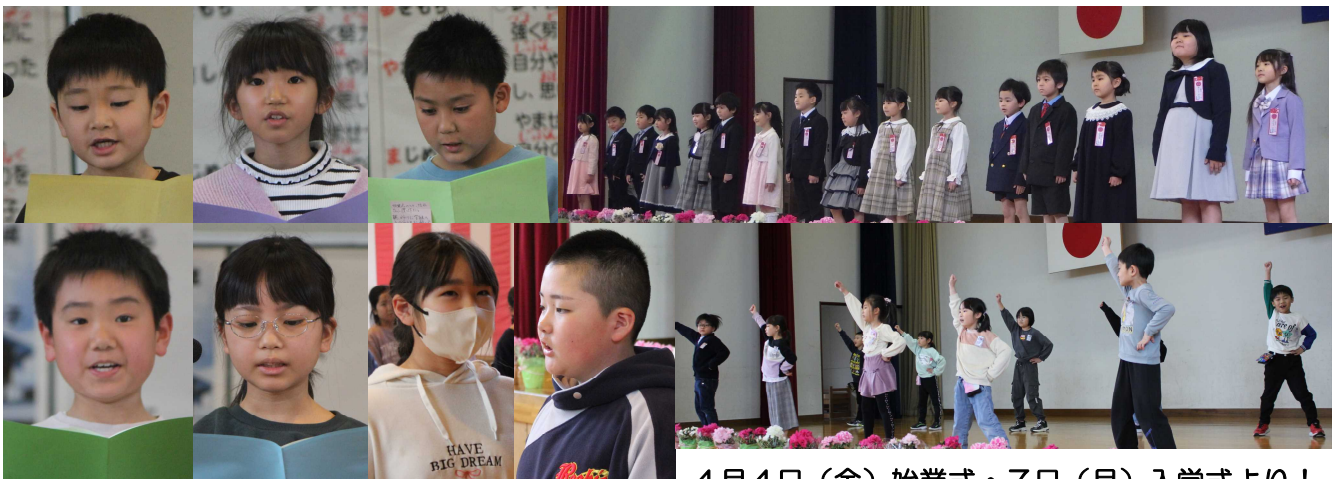
4月4日（金）始業式・7日（月）入学式より！