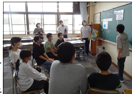
6年算数 分数のかけ算

6年生の算数の授業の様子を、2人の指導主事の先生に見てもらいました。今年を目指す授業は、「自分の考えをもち、すすんで学び合う子ども」です。6年生の子どもたちは、辺の長さが分数の時、面積と体積をどのようにして求めることができるかを、公式や図を使いながら考えました。学び合いの場面では、公式や図を使いながら、根拠を基に説明する姿がありました。話型を使って順序よく説明できていること、学級全体で学ぶ雰囲気がとてもよいことなど、たくさんお褒めの言葉をいただきました。他の学年でも、自分の考えをしっかりともち、共感的・協働的に学ぶ子どもを目指しています。指導・支援の仕方についてアドバイスいただいたことを真摯に受け止め、教職員みんなですらに力量を高めていきたいと思えます。