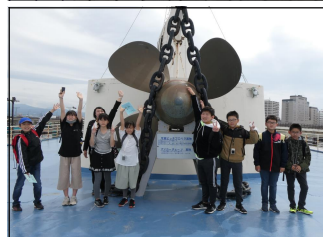
左上：五稜郭跡 左下：函館山からの夜景 右上：旧公会堂 右下：摩周丸