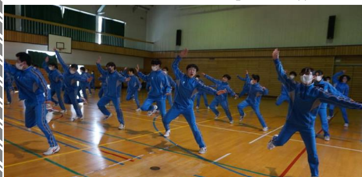
みんなで踊る最後のソーラン

また、3年生を送る会は生徒会執行部が企画した寸劇や恩師からのメッセージなどで3年生を楽しませました。また、3年間の思い出を振り返る場面では、仲間とともに笑顔で映像に見入っていました。最後は全員で「キセキ」の大合唱。心温まる素晴らしい会となりました。