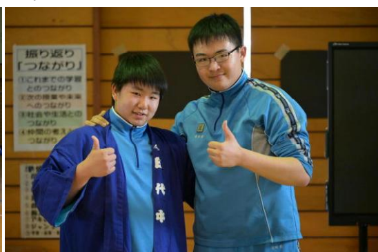
新リーダーへ長半纏が引き継がれます