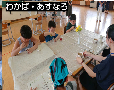
わかば・あすなろ