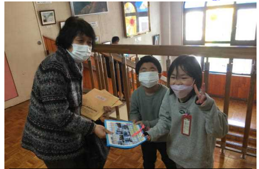
1年生はお礼のお手紙をプレゼント

きめきスキーが上達し、5年生は、綺麗な仕上がりのエプロンが完成しそうです。お忙しいところたくさんのご支援をいただき感謝申し上げます。