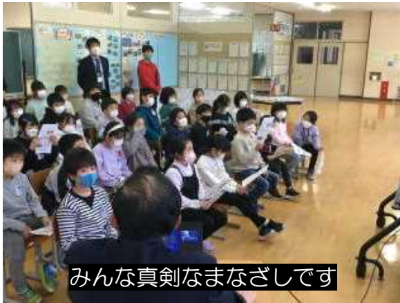
みんな真剣なまなざしです

【樹木医さんの診断結果】 染井吉野の寿命は、およそ60年であるが、樹齢120年以上の木がたくさんあることに驚いた。手をかけてあげれば、まだまだ元気に花を咲かせることができるでしょう。