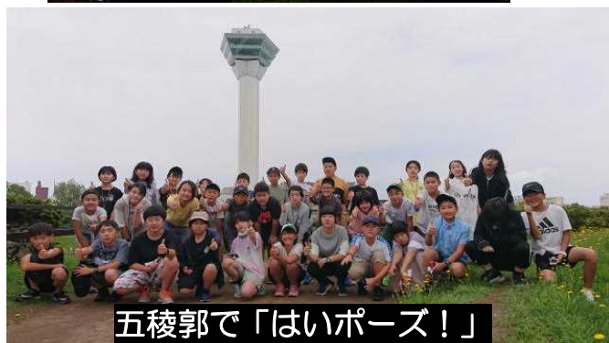
五稜郭で「はいポーズ！」