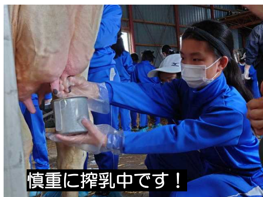
慎重に搾乳中です！