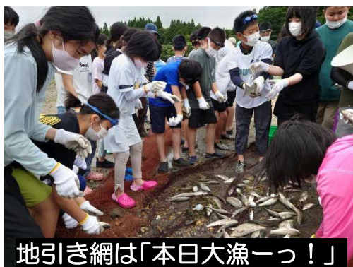
地引き網は「本日大漁ーっ！」

この「宿泊体感学習Ⅲ & 修学旅行」での楽しかった貴重な体験を今後の学校生活に生かし、釈迦内小学校のリーダーとして学校を引っ張って行ってほしいと思います。