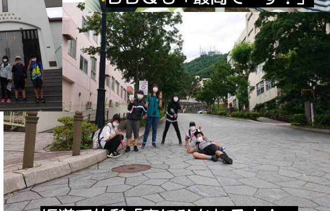
坂道で休憩「車にひかれるよ！」