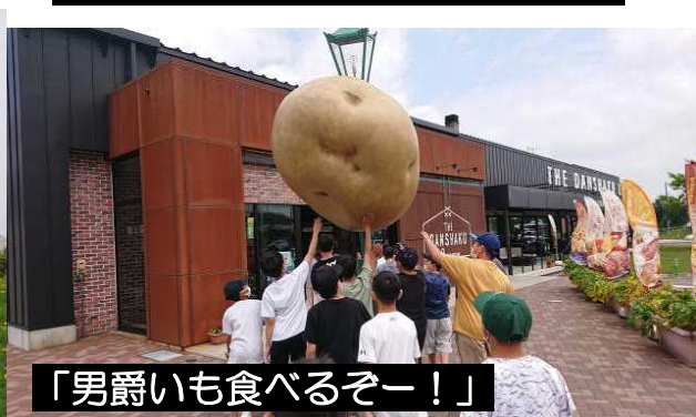
「男爵いも食べるぞー！」