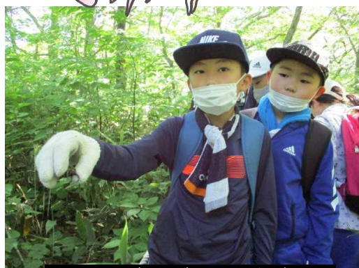
「クワガタゲットだぜ!」