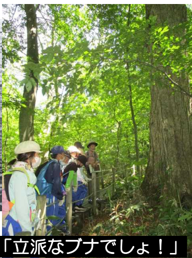
「立派なブナでしょ!」