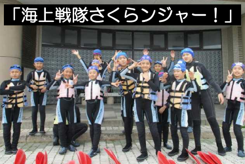
「海上戦隊さくらンジャー!」