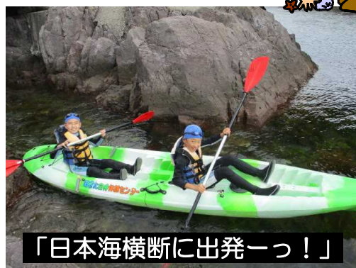
「日本海横断に出発ーっ!」