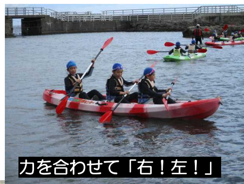
力を合わせて「右!左!」