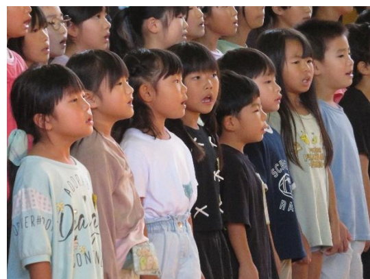
【全校合唱：「にじ」「光り～花をさかせよう～」