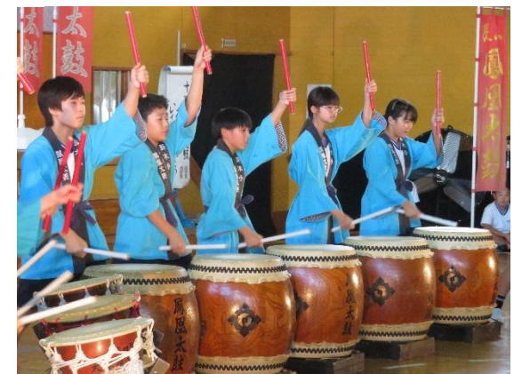
6年生「鳳凰太鼓 『大地』『清流』 『レインボー～未来への架け橋～』