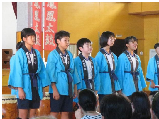
【6年生代表：おわりの言葉】