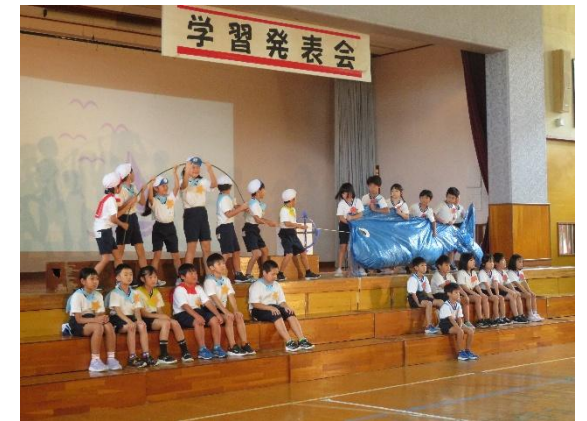
2年生「ハーモニーようちえんの 大ぼうけん くじらとり」