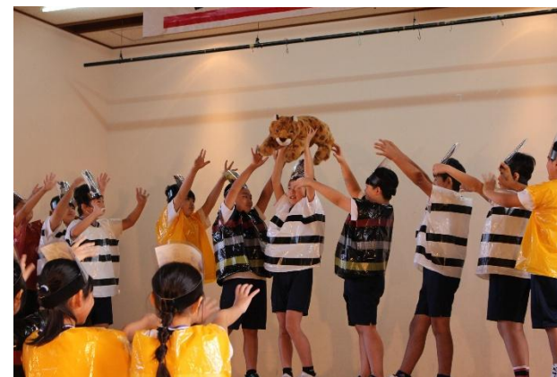
5年生「アナザーストーリー ライオンながキング」