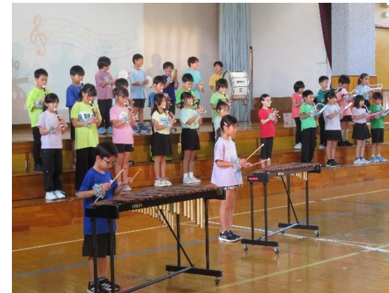
3年生「みのり学年 やれば・できる子 Y・D・K」