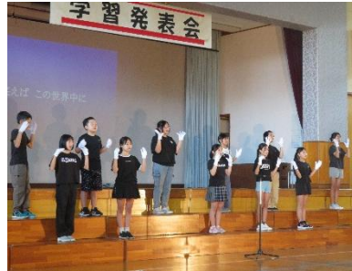
【手話クラブ：ハピネス】