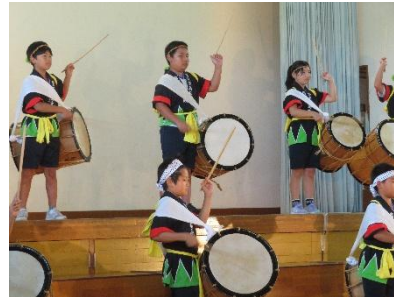
【伝承クラブ：鹿島太鼓】