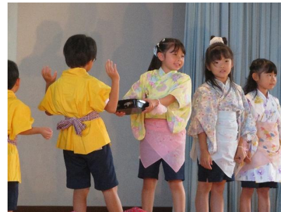
1年生「うらしまたろう ～いちばんぼし ver～」