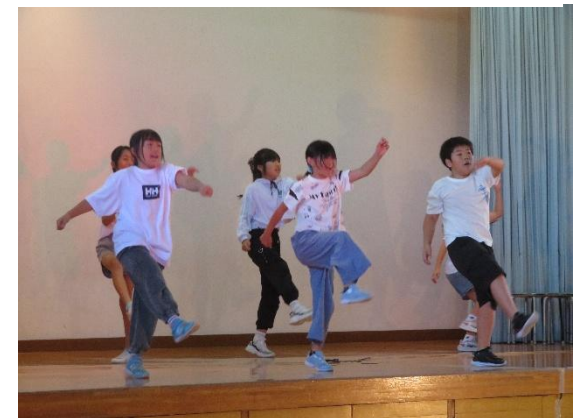
4年生「笑顔と成長を届けよう ～2分の1成人式～」