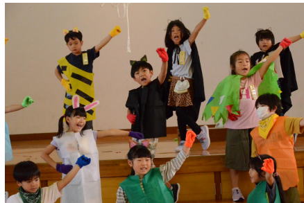
かけ声勇ましくもかわいい1年生

先週末の各学年のお便りは、「学習発表会」一色でした。校長便りもか……と思われるかもしれませんがお許しください。各学年とも既に本番の衣装を着て、本番さながらの真剣さで取り組んでいます。手前味噌になりますが、短期間で完成までにもっていく先生方の指導力と子ども達のがんばりには驚かされます。特に、予行から本番までのわずか2～3日間でさらにグレードアップするというのですから、まさしく「鉄は熱いうちに打て」だと感じます。