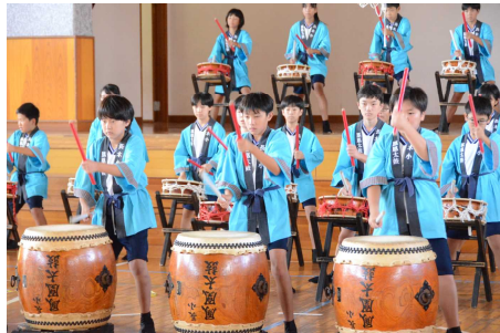
本番に向けて真剣そのもの6年生