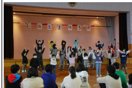
←【1年生 サングラスで クールに決めました】