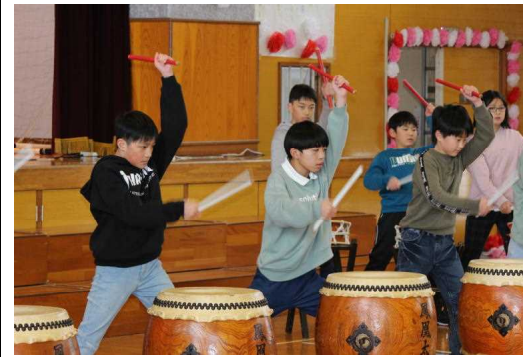
【5年生 来年は自分たちに任せて】