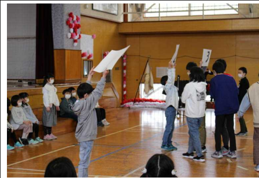
【3年生 学校に関する3択クイズ】