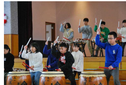
【これが、ぼく・私たちの『清流』!! この勇姿を覚えていてね】