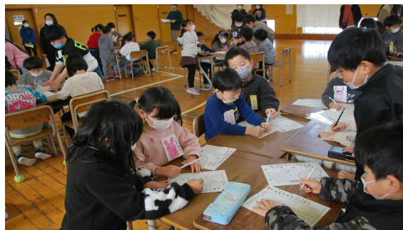
【1年生 幼保小交流会】

自分たちより多い38名の年長さんをおもてなした1年生。手をつないで校内案内をした後は、体育館でゲームをしたり、机に座って名前を書いたり。司会やゲームの説明も自分たちで進めた1年生は、すっかりお兄さん・お姉さんの顔でした。