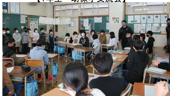
【5・3年生 相談にのってください】

ある日、5年生の教室に全員で入っていく3年生を発見。6年生を送る会でクイズをすることになったけれど、その内容で意見が分かれ、5年生に意見を求めに来たとのこと。急に、尋ねられた5年生でしたが、送る会の目的をしっかりと意識しながら、自分の言葉で分かりやすく答えていた子どもたちに感心しました。晴れやかな表情で教室を出て行った3年生の後ろ姿も、たくましく見えて、心がポカポカする素敵な朝の出来事でした。