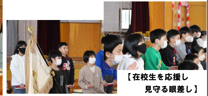
【5年生へ引き継がれた校旗】