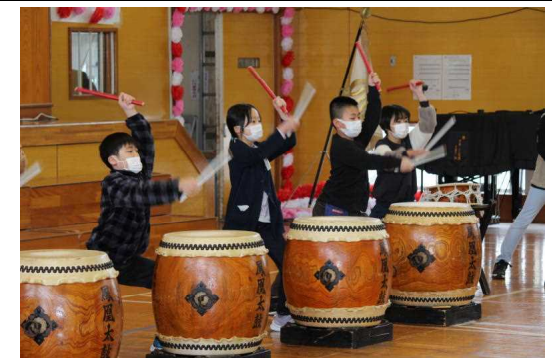
【4年生 初めての太鼓演奏披露】