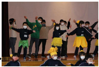
【2年生 6年生も巻き込 んでのエゾポップ体操】→