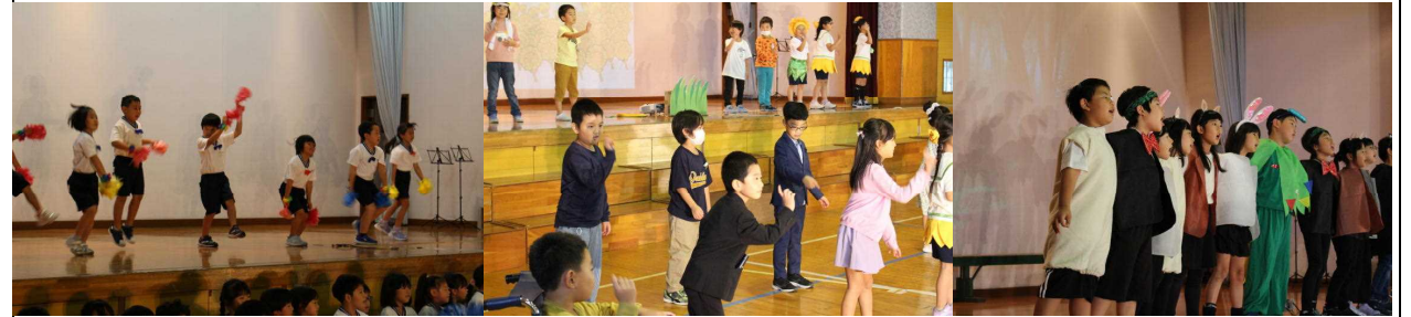
【軽やかなステップ！】