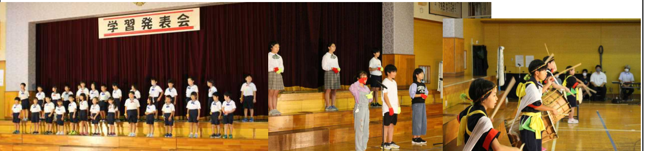
【元気いっぱい歓迎の言葉】