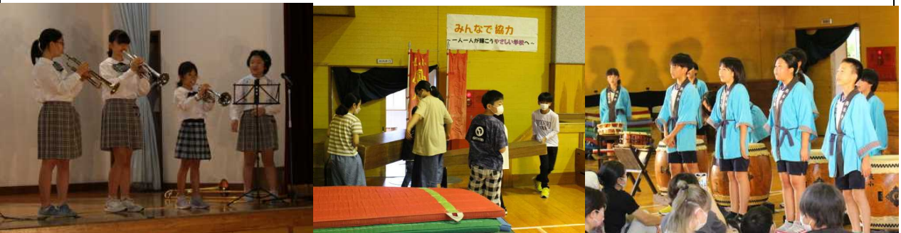
【楽器の音色も聞かせてくれました】