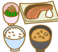
栄養バランスの よい食事