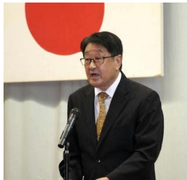
<式典:五十嵐様祝辞>