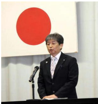
<式典:長岐教育長祝辞>

昨年からの準備を重ねてきたPTA役員の方々をはじめ、御協力くださいました関係の方々、保護者の皆様に深く感謝申し上げます。