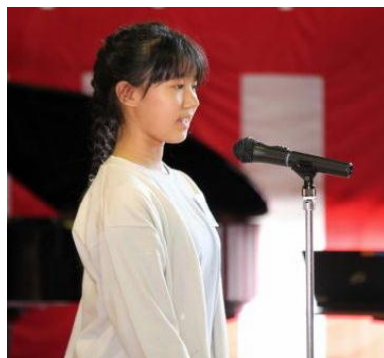
<学習発表会:終わりのことば>

11日(土)の午前中には、学習発表会が行われました。各学年工夫を凝らした演目で、それまでの練習の成果を十二分に発揮した元氣いっぱいのステージをお見せしました。