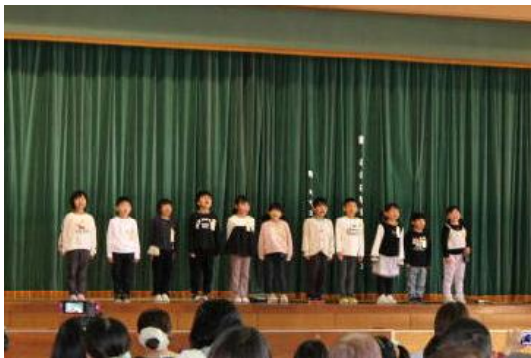
<学習発表会:1年生によるはじめの言葉>