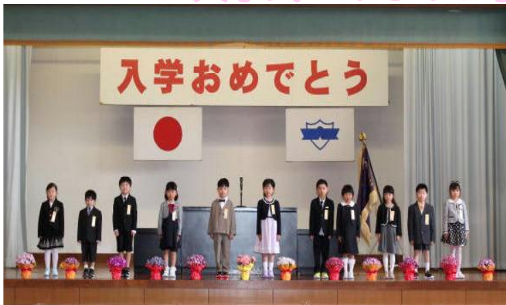
<ピカピカの11人の1年生>

御来賓の皆様の御臨席を仰ぎ、保護者の方々や在校生に見守られる中、11名のピカピカの1年生の入学式が行われました。どのお子さんも担任の先生の呼名に元気な声で返事をし、校長先生のお話を最後まで立派に聞くことができました。