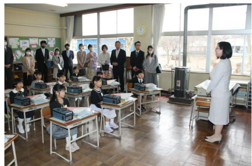
<初めての学級活動>

4月は、小学校生活に慣れるとともに学習の土台作りをしていきます。輝く笑顔を毎日見ることができるよう、学校全体で見守っていききたいと思います。