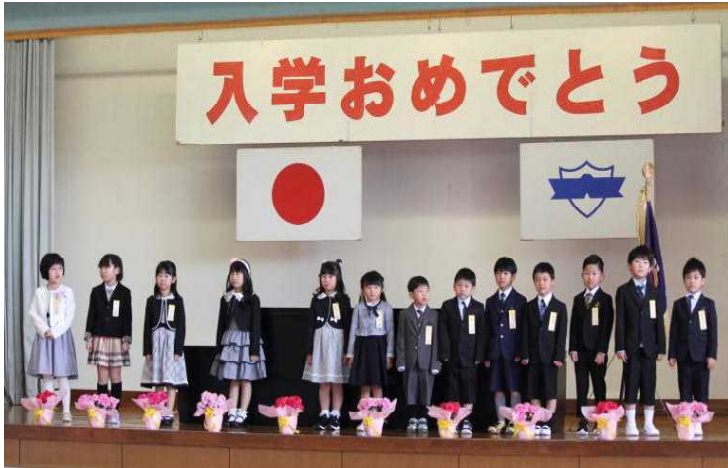
<ピカピカの13人の1年生>