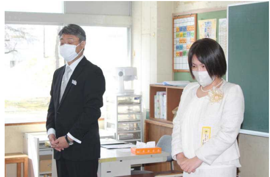
<1年担任の自己紹介>

保護者の皆様や在校生、ご来賓の方々に見守られる中、13名のピカピカの1年生の入学式が行われました。どのお子さんも担任の先生の呼名に元気な声で返事をし、校長先生のお話を最後まで立派に聞くことができました。また、入学式の後には「1年生を迎える会」が行われました。6年生の代表児童が歓迎の言葉を話した後、2年生が南小の1年間の様子を紹介しました。1年生は、2年生の発表に興味津々で、最後の歌では一緒に踊り出すお子さんもおりました。