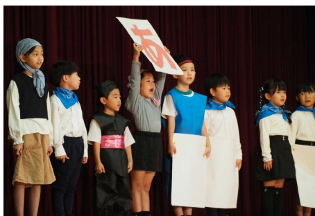
1年生代表児童による 「開会の挨拶」