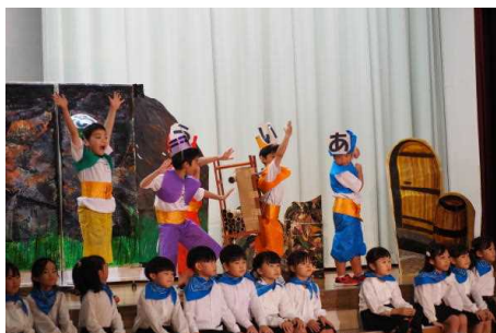
1年生「あいうえおりばば」

今年度もご来場の皆様のご協力のお陰で、子どもたちの笑顔があふれる一日となりました。皆さんからの温かい拍手に、子どもたちは満面の笑みで帰路につくことができました。ありがとうございました。子どもたちのがんばりを、後期の学校生活や学習にも生かしたいと思いますので、今後も、引き続きよろしく願います。