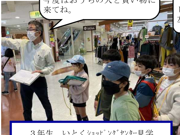
3年生 いとくショッピングセンター見学

人は無視されることが一番悲しい。注意 したり、教えてくれたりすることは 友達だと思っているからなんですよ。