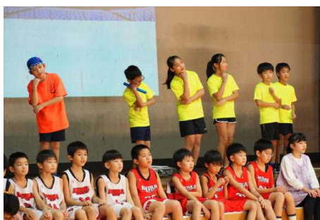
4年生「未来の色は”かがやき” のいろ ～10歳を祝う会～」