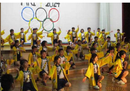
5年生「ARIオリンピック」 ～75人の金メダリスト～