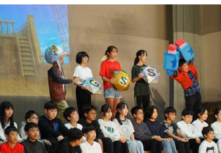
6年生「ワンピースリターンズ ～エピソードオブSDGs～」