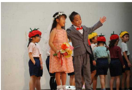
2年生「ぐんぐんそだて！ 『チームきらり』