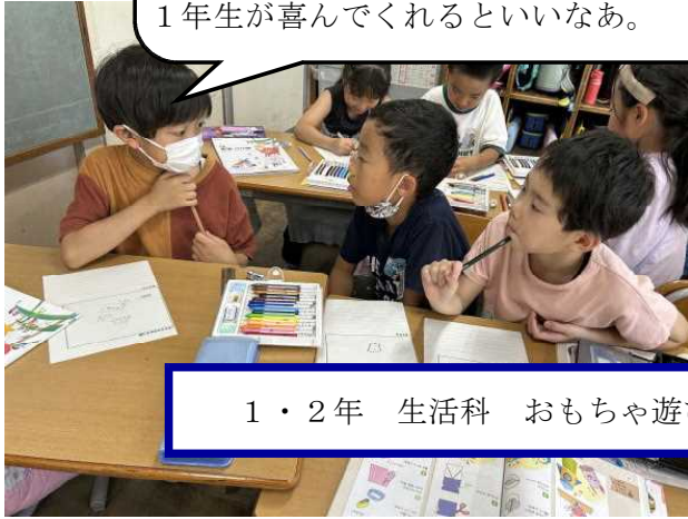
1・2年 生活科 おもちゃ遊び