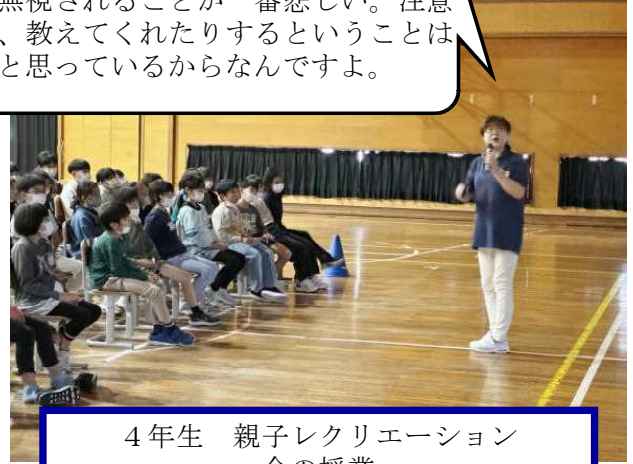
4年生 親子レクリエーション 命の授業

人は無視されることが一番悲しい。注意 したり、教えてくれたりすることは 友達だと思っているからなんですよ。