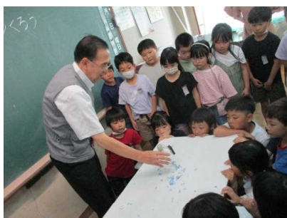
〈3年生 発明工夫講話〉