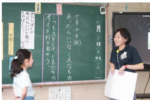
〈各種訪問授業公開〉