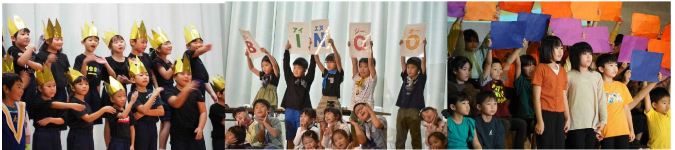
1年生「うたのきれいな王様」

今年度もご来場の皆様のご協力のお陰で、子どもたちの笑顔があふれる一日となりました。たくさんの温かい拍手に、子どもたちはとても満足したよい笑顔で帰路につくことができました。ありがとうございました。子どもたちのがんばりを、後期の学校生活や学習にも生かしたいと思いますので、今後も、引き続きよろしく願いいたします。