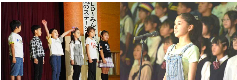
1年生14人で「開会の挨拶」