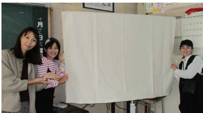
「手作り電子黒板カバー」