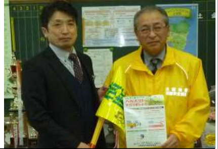
交通安全協会より、旗とパンフレットをいただきました。